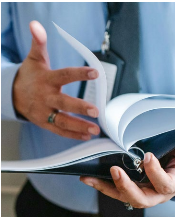
Ein Blick in die Versicherungsbedingungen – gerne durch uns – erleichtert die bedarfsgerechte Risikoeindeckung.

Bewegen Sie sich im Rahmen der Mindestversicherungssummen, ist gesetzlich vorgeschrieben, wie Ihre Maximierung oder auch Jahreshöchstleistung ausgestaltet ist. Darüber hinaus können Sie die Maximierung oft frei wählen. Üblicherweise bieten die Versicherer stets eine 2-fache Maximierung an. Es ist aber durchaus anzuraten, zu überprüfen, ob nicht eine höhere Versicherungssumme mit 1-facher Maximierung passender für Ihre Kanzlei ist. Hierzu sollte Ihr Versicherungsmakler mit Ihnen die Mandatsstruktur analysieren.